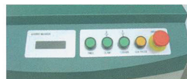
Pannello di controllo Control panel